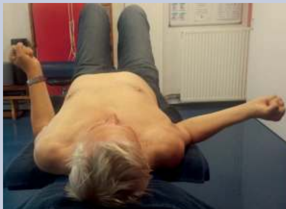
Man, 65, FS L, frozen fase, matige/lage reactiviteit, richtlijn-profiel II – exorotatie in rugligging: circumductie positie 1 met gebalde vuisten, ter facilitatie van het 'gecentreerd' bewegen in de richting van positie 2, de Close Packed Position

Mate van bewegingsbeperking tijdens het FS-traject Door bij matige en vooral lage reactiviteit zeer frequent 'gecentreerd' te bewegen naar eindstanden op geleide van de '24 uur-regel', neemt de ROM toe dankzij prikkeling van fibroblasten en het verbrekten van niet-structurele crosslinks door Matrix Metallo Proteïnase.